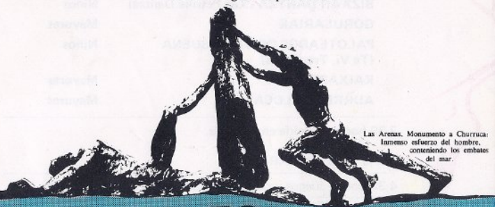
Las Arenas. Monumento a Churrucá: Inmenso esfuerzo del hombre, conteniendo los embates del mar.